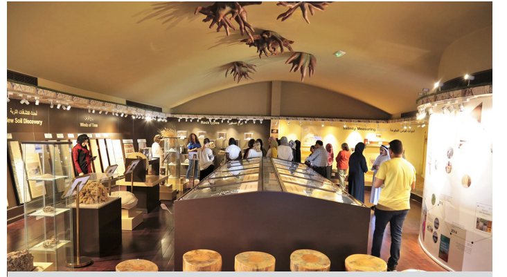
يستقبل المتحف بانتظام زوار من دولة الإمارات العربية المتحدة وغيرها من البلدان.

سيستمر المتحف أيضًا في زيادة عروضه من خلال برامج الرعاية إلى جانب أشكال أخرى من الدعم المالي.