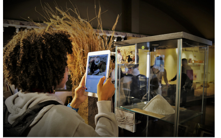
يستفيد الطلاب والباحثون والزائرون الآخرون من الموارد المتاحة في المتحف.

يستضيف المتحف أيضًا معسكرات الاستدامة ومسابقات للشباب، وأنشطة بناء الفرق للشركات، وجلسات الطهي الصحي في إطار برنامج مختبر المطبخ الملحي، والمعارض الفنية المؤقتة، والمحاضرات العلمية لجمهور متنوع.